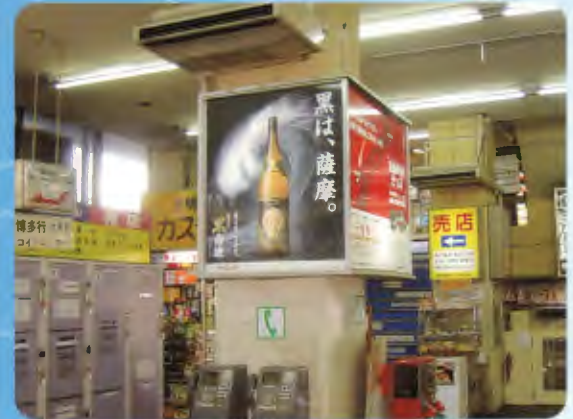
バスターミナル電照看板・ポスター

長崎県営バスを媒体とする広告は、今まで多くのお客様に喜ばれており、今後も企業や商品の宣伝活動の一環として皆様のご利用をよろしくお願いたします。